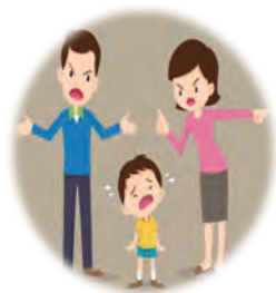
2.職業與生活安排 改變影響家庭成員的互動