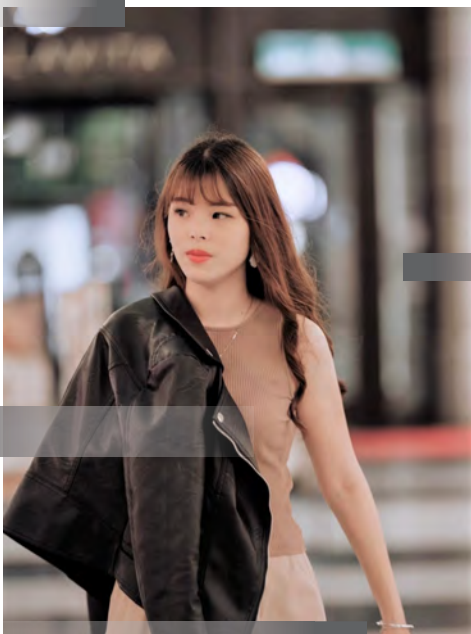
官 芸 如