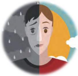
1.照顧者 之負面情緒