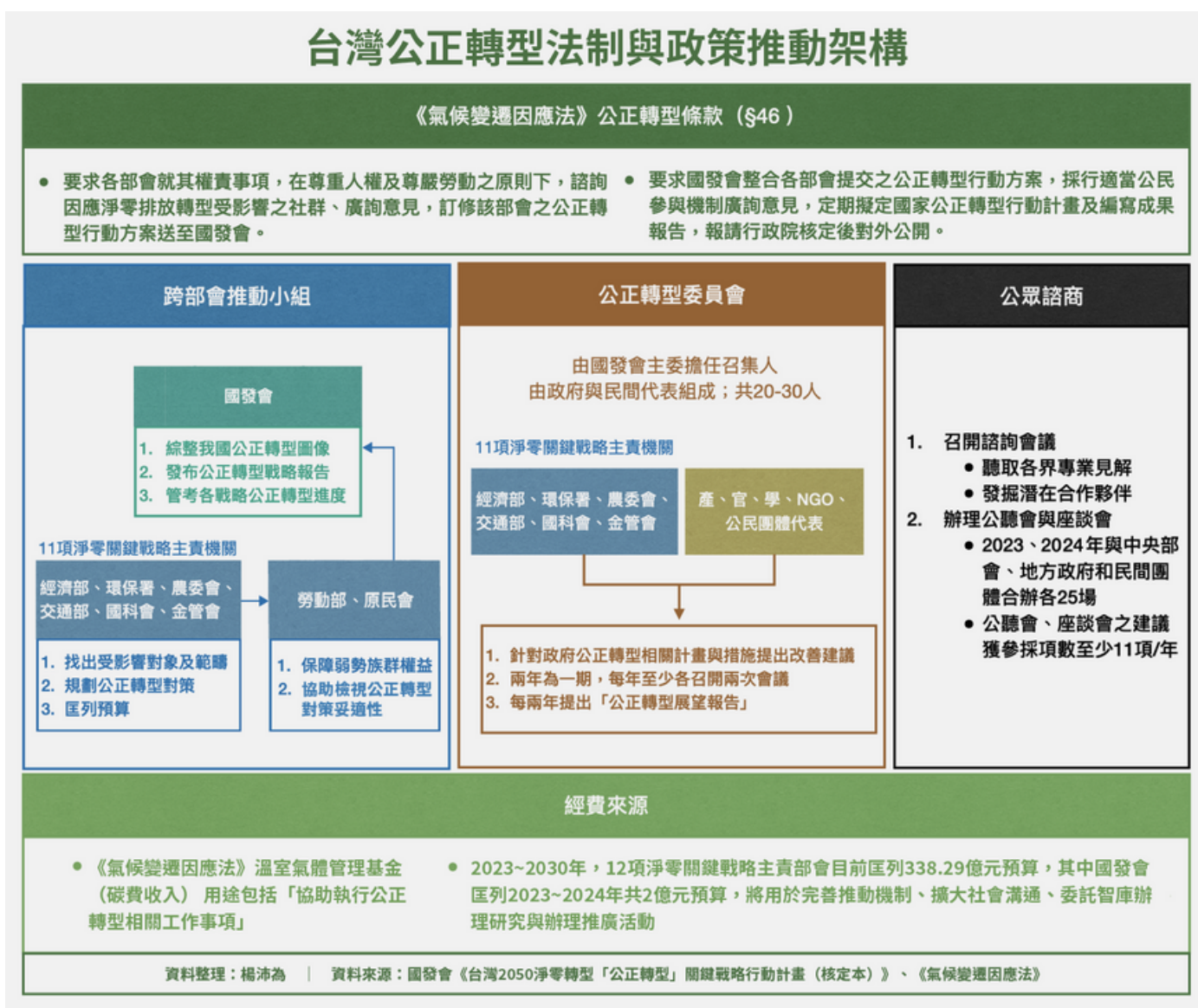
圖2.1 台灣公正轉型法治與政策推動架構

台灣氣候行動網絡研究中心也因此從資訊繁雜的12項淨零關鍵戰略行動計畫中，鑑別包括公正轉型在內的15項核心措施，透過「台灣淨零追蹤器」綜整出各措施當前內容、階段性目標、量化貢獻與推動進度，作為公眾參與監督政府淨零行動的基礎。每一項核心措施，均設立Slido互動介面，讓各界提出建議、回饋、疑問，研究中心亦將每季製作進度追蹤報告、彙整各界提出的重要意見。