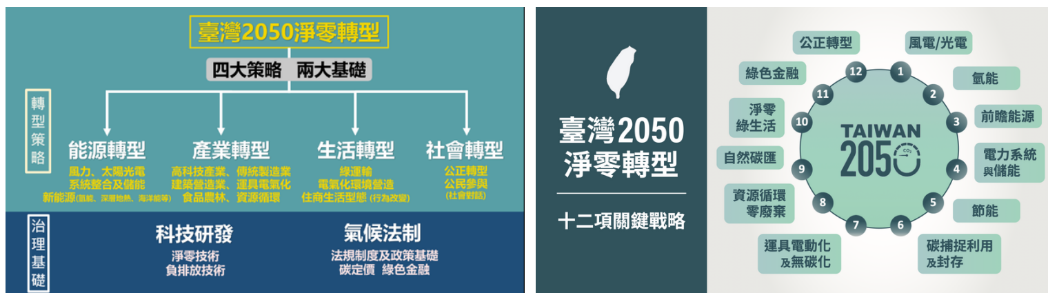
左圖1.1 臺灣2050淨零轉型四大策略兩大基礎。