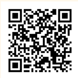
屏東縣遊民安置輔導辦法 屏東縣政府