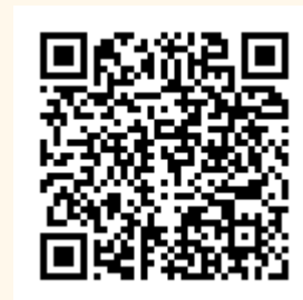
○○縣(市)遊民安置輔導自治條例範例 衛生福利部