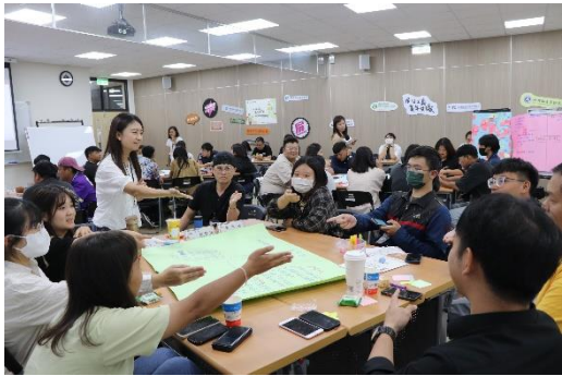
議題討論：第三小組無家者的居住正義