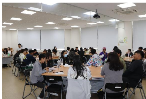
參與者共計36人，出席率100%