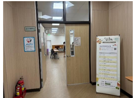
禁止性騷擾宣導及會場流程表