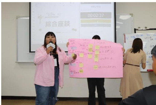
綜合座談：第一小組報告