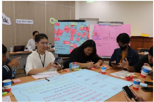
議題討論：第四小組無家者的居住正義