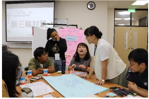
議題討論：第二小組無家者的居住正義