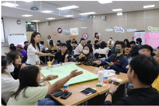
議題討論：第三小組無家者的居住正義