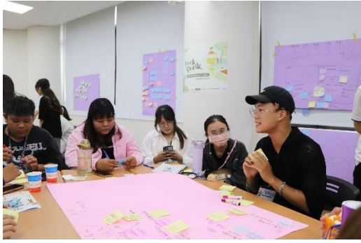
議題討論：第一小組無家者的居住正義