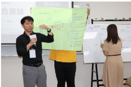
綜合座談：第三小組報告