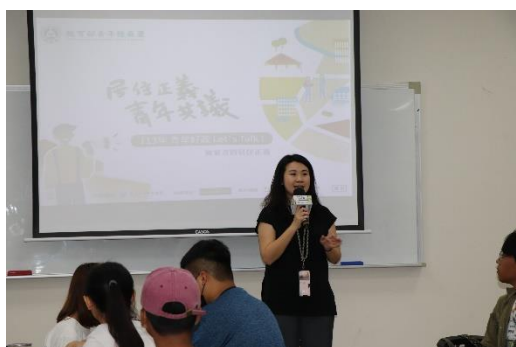
屏東縣政府勞動暨青年發展處/處長 李雨蓁