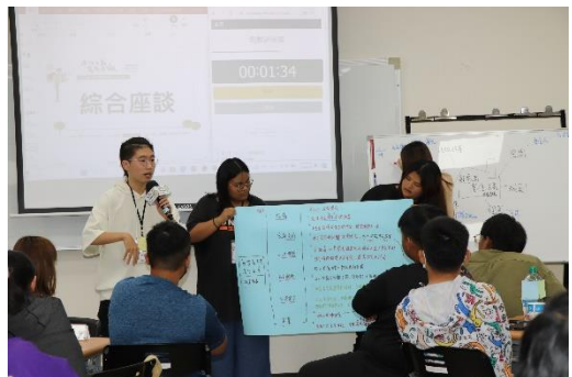
綜合座談：第四小組報告