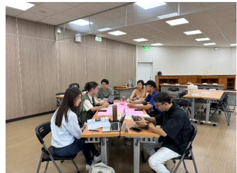
自主演練2-屏東縣遊民收容所田調