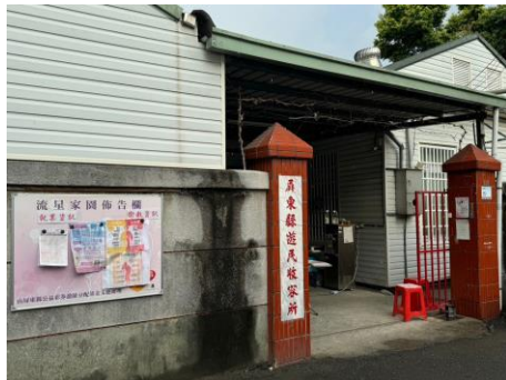
自主演練1-屏東縣遊民收容所田調