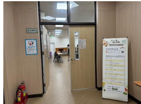
禁止性騷擾宣導及會場流程表