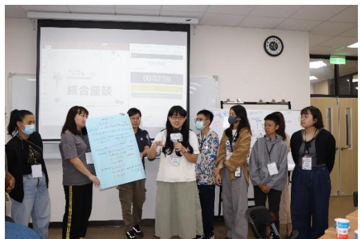
綜合座談：第二小組報告